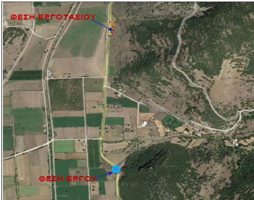
Εικόνα 3 : Θέση εργοταξιακού χώρου σε σχέση με το κυρίως έργο

Ως καταλληλότερος για εργοταξιακός χώρος επιλέχθηκε έκταση 1.700 m 2 περίπου, σε απόσταση 1Km από την θύση της γέφυρας.