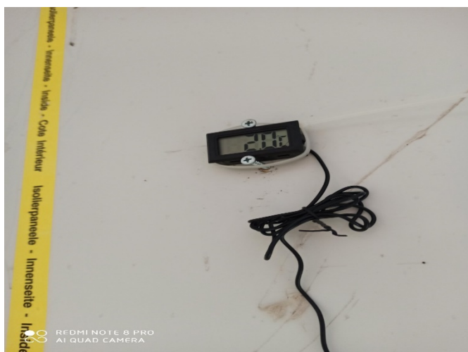
Φωτο 1: Ψυκτικός Θάλαμος ΕΑΥΜ